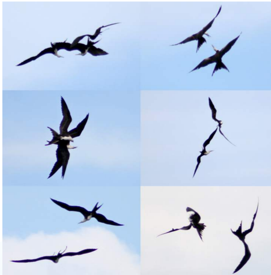
Figura 1: Fregata magnificens brincando