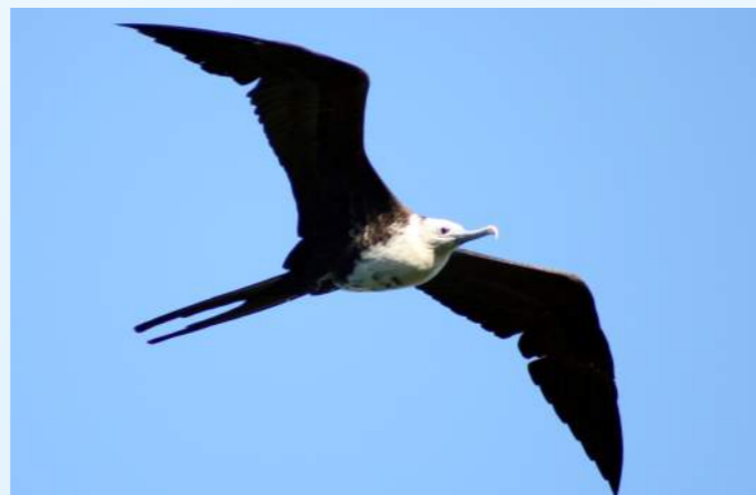
Figura 3: Fregata magnificens imaturo.